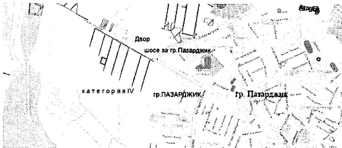
Фиг. 1 ПИ 55155.9.232 област Пазарджик, община Пазарджик, гр. Пазарджик, м. БАХЧЕ ПАРА

наводнения. Също така не се засягат СОЗ и зони със специален статут, не попада също така в защитена зона или защитена територия.